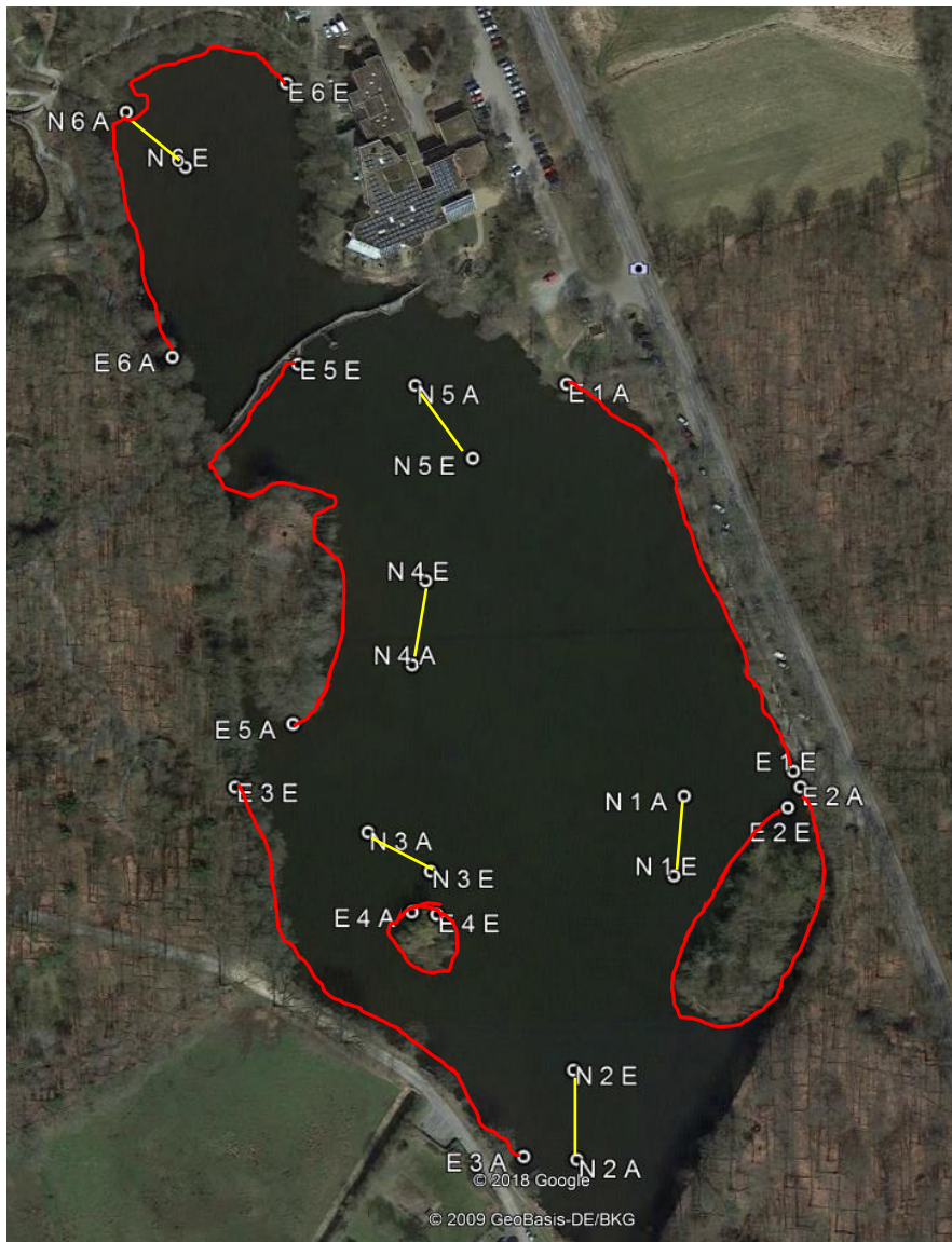
Abbildung 2: Lage der Stellnetze (gelb) und Elektrofischungen (rot) im Isenhagener See 2018.